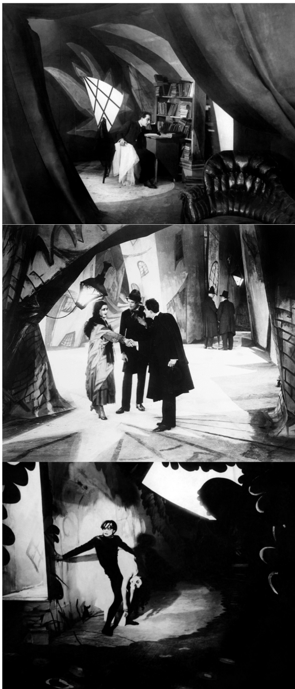
El gabinet del doctor Caligari , de Robert Wiene, 1919

OPCIÓ A. L'expressionisme alemany com a exemple d'interrelació entre la pintura i el cinema: El gabinet del doctor Caligari , de Robert Wiene, 1919. Característiques de l'expressionisme alemany com a moviment i de la pel·lícula com a exemple de col·laboració dels artistes plàstics i arquitectes al cinema.