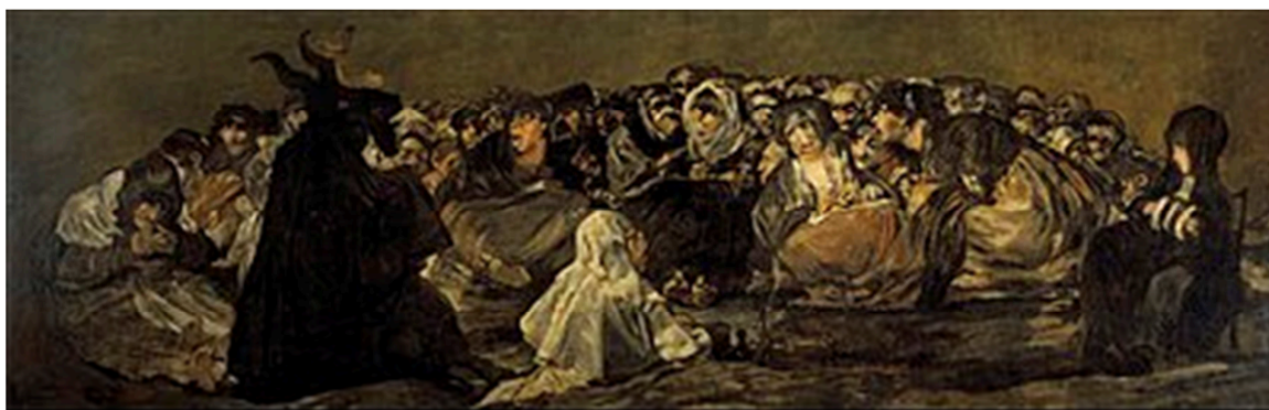
Francisco de Goya, Aquelarre , c. 1823