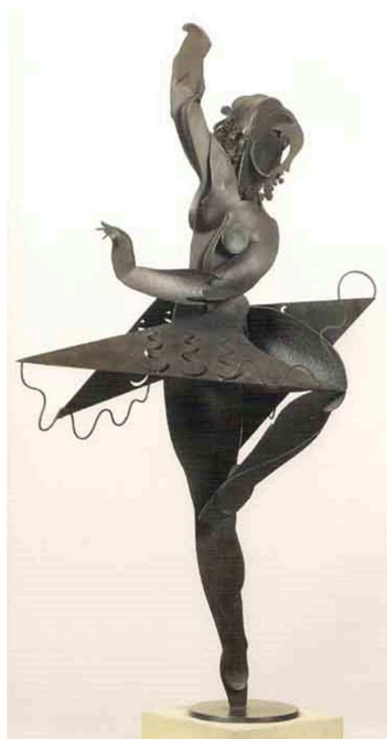
Pablo Gargallo, Gran ballarina , 1929