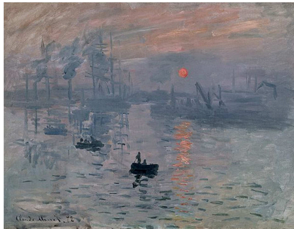
Claude Monet, Impressió, sol naixent , 1872