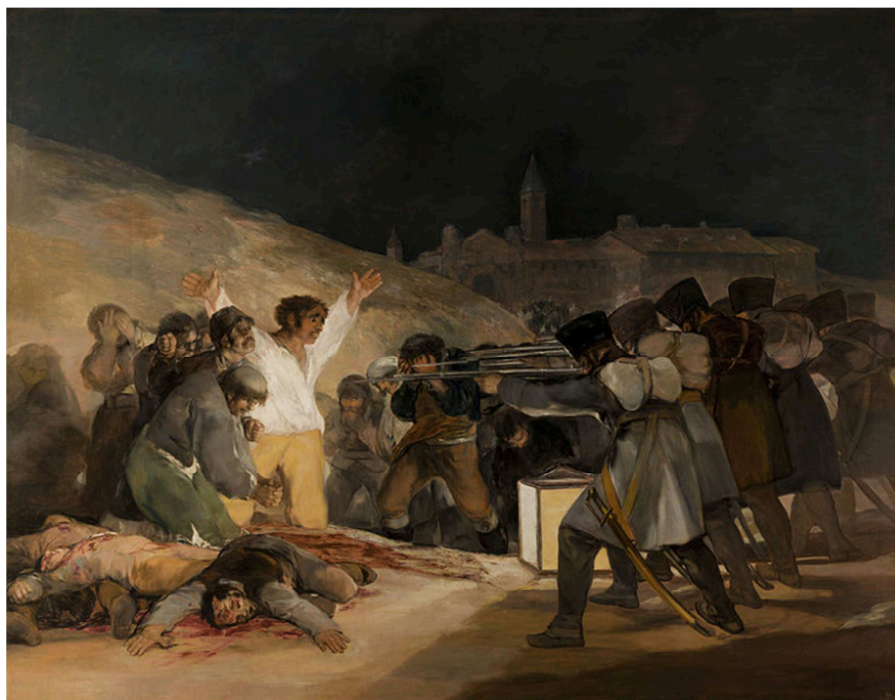
Francisco de Goya, El 3 de maig a Madrid o Els afusellaments de la Moncloa , 1814