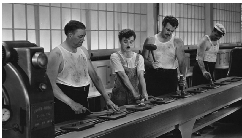
Charles Chaplin, Modern Times , 1936

OPCIÓ A. Relaciona el film de Charles Chaplin Modern Times (1936) amb la fotografia Migrant Mother (1936) de Dorothea Lange.