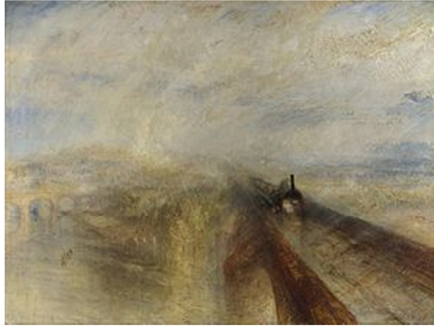
William Turner, Pluja, vapor, velocitat , 1844

OPCIÓ B. Relaciona aquestes dues obres: Pluja, vapor, velocitat , de William Turner, i Impressió, sol naixent , de Claude Monet: