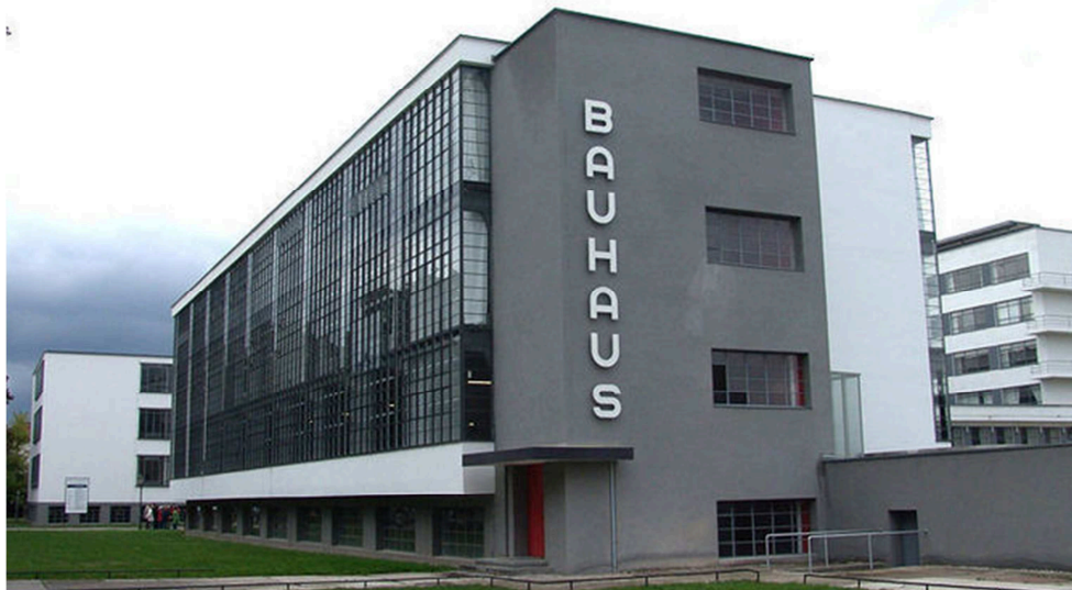
Walter Gropius, Staatliche Bauhaus (Casa de la Construcció Estatal). Dessau, 1925