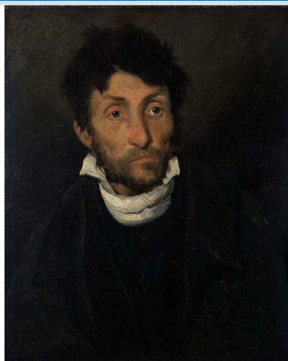
Théodore Géricault, El cleptòman o El boig assassí , 1822-23